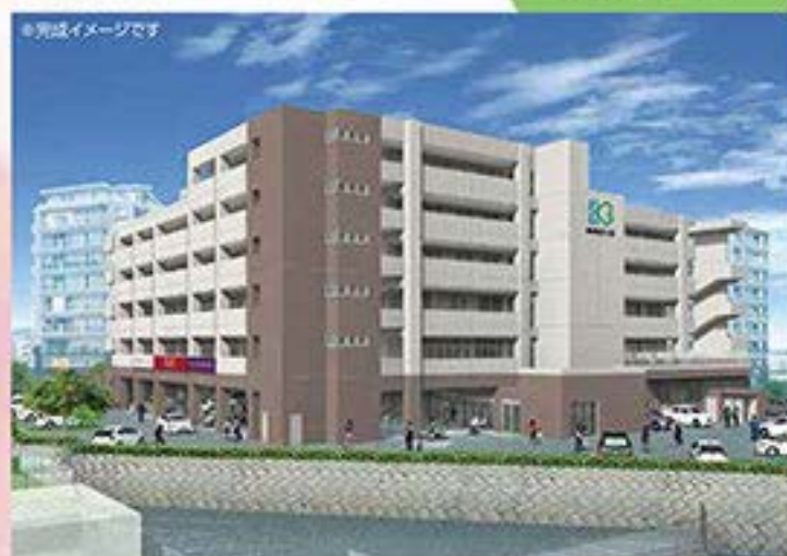
※完成イメージです